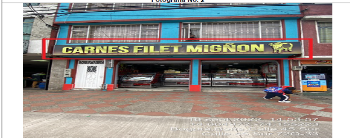
En la cual se evidencia un (1) elemento tipo aviso en fachada ubicado en antepecho de segundo piso, perteneciente al establecimiento comercial CARNES FILET MIGNON , el cual al momento de la visita se encontraba instalado sin el registro ante la SDA.