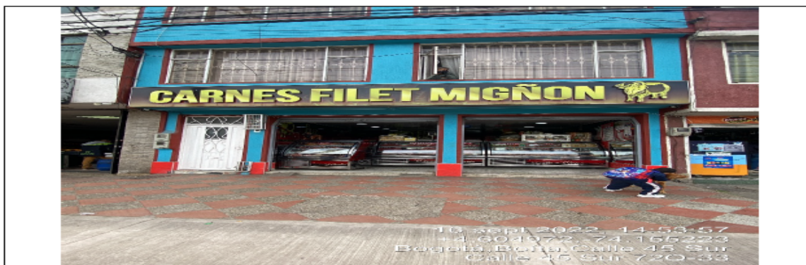
En la cual se evidencia la fachada del establecimiento comercial CARNES FILET MIGNON , en la CL 45 sur No. 72 Q - 33 de la localidad de los Kennedy.